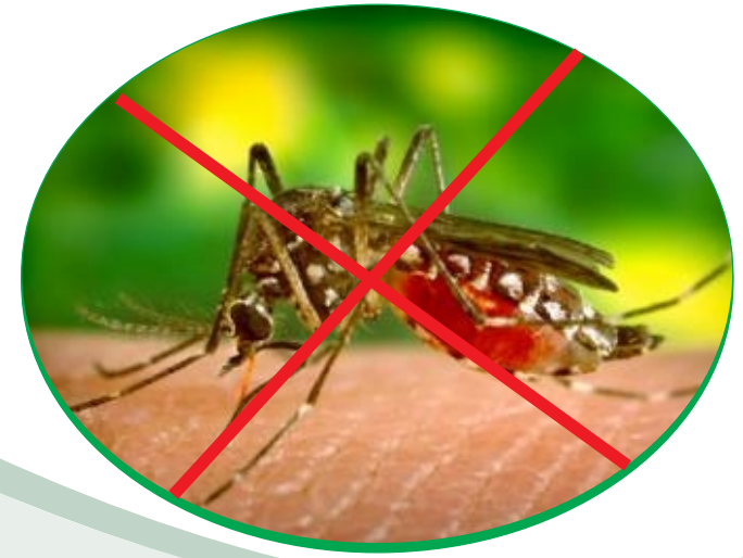
MUỖI VẄN ( Aedes aegypti )

KHÔNG LĂNG QUĂNG, KHÔNG BỌ GÂY, KHÔNG MUỖI, KHÔNG SỐT XUẤT HUYẾT